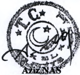
AZİZ NAS Belediye Başkanı

Belediye Meclisinin 03/09/2021 tarihli toplantısında oy birliği ile karar verilmiştir.